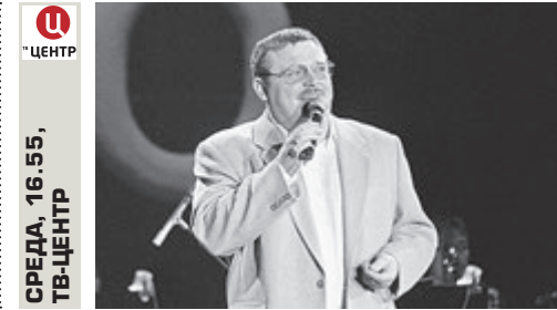
СРЕДА, 16.55, ТВ-ЦЕНТР

Захватывающая история подпольной организации «Братский союз военнопленных», которая действовала буквально внутри структуры немецких концлагерей. 9 марта 1943 года в одном из берлинских домов проходила их тайная встреча.