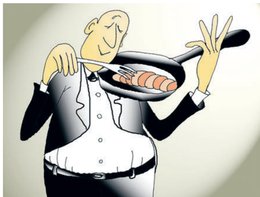
ИЛЛЮСТРАЦИЯ НИКОЛАЯ НИЧАРОВА

Конечно, традиционная еда нигде не денется, соглашаются ученые, но люди будут стремиться контролировать процесс производства: делать заказы напрямую фермерам, устраивать в подвалах домов рыбные садки и засевать крыши. «Некоторые