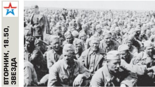
ВТОРНИК, 18.50, ЗВЕЗДА