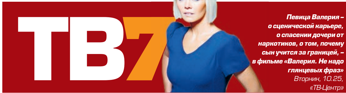
Певица Валерия – о сценической карьере, о спасении дочери от наркотиков, о том, почему сын учится за границей, – в фильме «Валерия. Не надо глянцевых фраз» Вторник, 10.25, «ТВ-Центр»