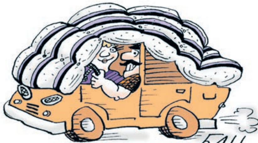
ИЛЛУСТРАЦИЯ: БОРИС ЦЫГАНОВ / CARTOONBAN.RU