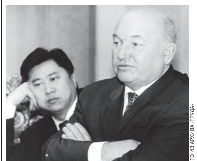
Юрий Лужков бывал в гостях в редакции «Труда».

Человек-эпоха. Настоящий москвич. Политический тяжеловес... Лестные эпитеты несутся ему вдогонку, и даже если отбросить сказанное ради политеза, суть не меняется. А она такова. Юрий Лужков принял в 1992-м в управление город, который больше напоминал послевоенный. Помните Москву начала 90-х? Темные даже в центре ночные улицы. Переполненные мусором урны всюду, где теплится жизнь. Свечки у станций метро, под которыми люди-тени торгуют снедь, скарбом и прочей всячиной. Стаи крыс-мутантов, вылезавших из подвезки. И это декорации не к фильму ужасов, а к той нашей жизни. Оставляя же мэра Лужкова Москву совсем другой – вычищенной, развивающейся, залитой огнями. Мегаполисом мирового уровня. Со МКАД вместо прежней окружной «дороги смерти». С новыми жилыми районами. Сверкающими торговыми мегакомплексами. Храмом Христа Спасителя взамен бассейна «Москва». С прибавкой к пенсии, которую до сих пор зовут «лужковской»... В июне 1992-го из-за перебоев в поставках в столицу еды ушел в отставку мэр Гавриил Попов, и новым городским главой стал Лужков. Первый вопрос депута-