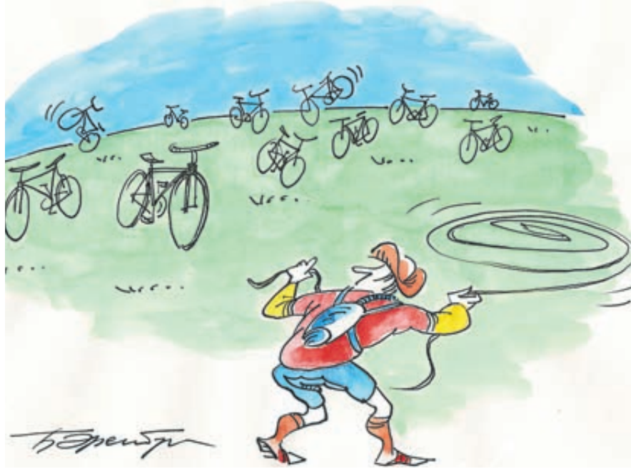
ИЛЛЮСТРАЦИЯ БОРИСА ЭФЕНБУРГА / САЙТООБРАМКА.RU

Тренд, увы, не ускользнул от внимания воришек. Тем более все чаще продвинутые горожане сделают велосипеды стоимостью в десятки и даже сотни тысяч рублей. А вот со средствами защиты движимого имущества намного хуже. Воры выходят «на дело» с целым набором инструментов: кусачками, болторезами, аккумуляторными болгарками, перед которыми пасуют любые цепи и замки.