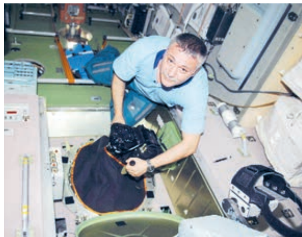
Федор Юрчихин – это вам не робот Федя, недавно слетавший на МКС.

– Кстати, и Геннадий Падалка тоже ушел (точнее, его ушли) по такой же причине. Геннадий Иванович говорил, что, мол, не мог сидеть больше без дела. А в действительности боялись его принципиальности и поэтому выдавили. Нынешний скандал – еще один сигнал: