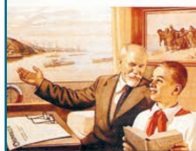
СБЫЛИСЬ МЕЧТЫ НАРОДНЫЕ!

– Граждане правы. Обратимся к Госкомстату: больше 20% россиян – за чертой бедности. А у полины всего четыре прожиточных минимума, что гарантирует не жизнь, а выживание. Вот и получается 70% нищих и малообеспечен-