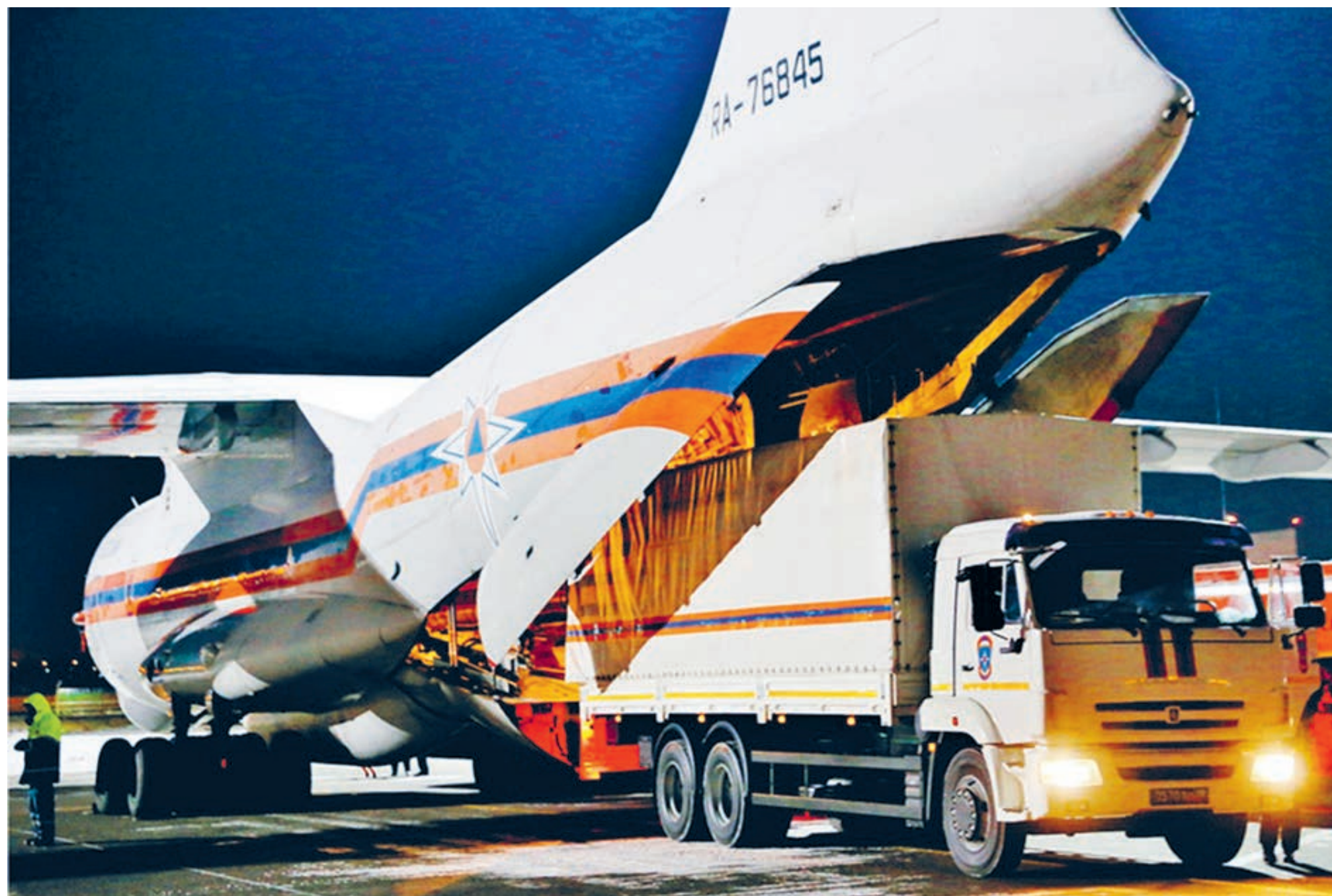
Погрузка транспортного самолета с медицинской помощью, предоставленной правительством России Китаю, 8 февраля 2020 года.