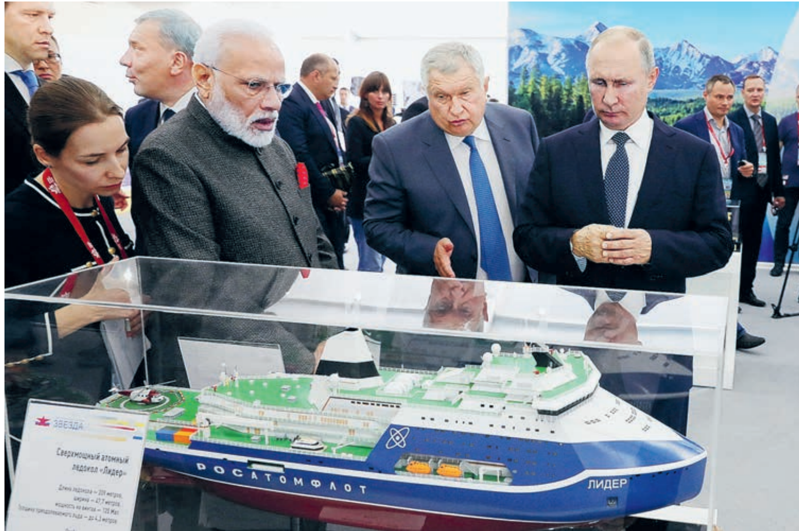
Президент России Владимир Путин и премьер Индии Нарендра Моди оценили макет суперледокола «Лидер».