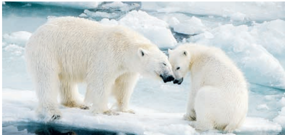
Фауна Российской Арктики стала предметом особых забот компании «Роснефть».

«Роснефть» ведет изучение Арктики с 2012 года. При участии специалистов ООО «Арктический научный центр» компания организовала и провела более 20 комплексных научно-исследовательских арктических экспедиций. А в период до 2023 года включительно проведет еще восемь экспедиций в море Лаптевых, Баренцевом и Карском морях. В них примут участие ведущие ученые из крупнейших российских исследовательских центров: Института проблем экологии и эволюции им. А.Н. Северцова, Арктического и антарктического научно-исследовательского института и Сибирского федерального университета.