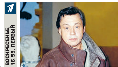
ВОСКРЕСЕНЬЕ, 16.55, ПЕРВЫЙ

К 80 – летию со дня рождения Николая Караченцова знаменитый спектакль «Леннома» 1981 года – детище режиссера Марна Захарова, номозпозитора Алексея Рыбникова и поэта Андрея Вознесенского.