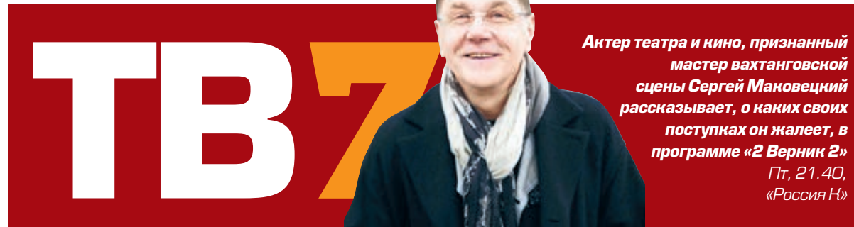
Актер театра и кино, признанный мастер вахтанговской сцены Сергей Маковецкий рассказывает, о каких своих поступках он жалеет, в программе «2 Верник 2» Пт, 21.40, «Россия Н»