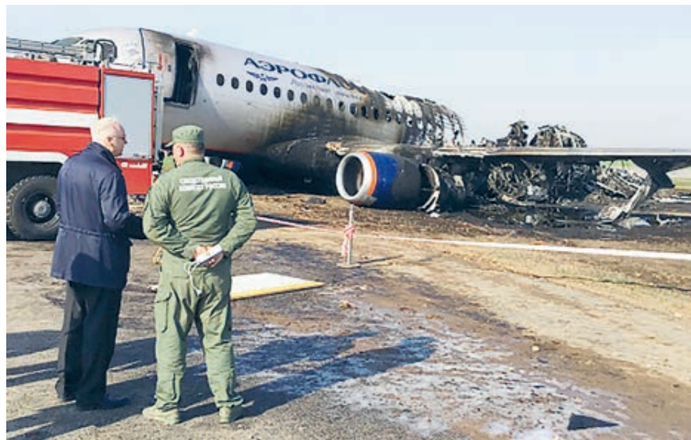
Глава СК России Александр Бастрыкин на месте катастрофы в Шереметьево.

«Современное оборудование в большинстве случаев позволяет избежать серьезных последствий столкновения с грозным фронтом, – говорит генеральный директор Международного консультативно-аналитического агентства «Безопасность полетов» Сергей МЕЛЬНИЧЕНКО. – Предусмотрена специальная защитная система, включающая проложенную вдоль обшивки судна экранирующую сетку, выведение возникающих статических зарядов с помощью установленных на концах крыльев электростатических разрядников. Но в данном случае, судя по